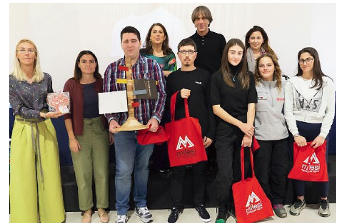
Gli studenti e la giuria del «Milesi Talent»