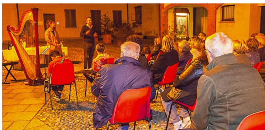
La serata di venerdì a Cascina Mirabello